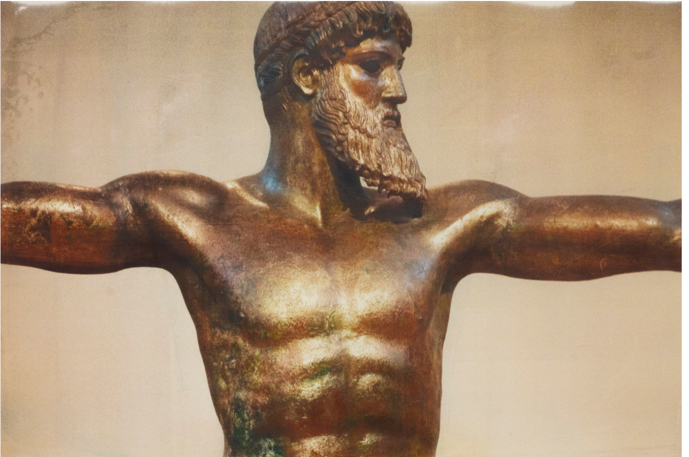
Bronze de l'Artémision, 2019