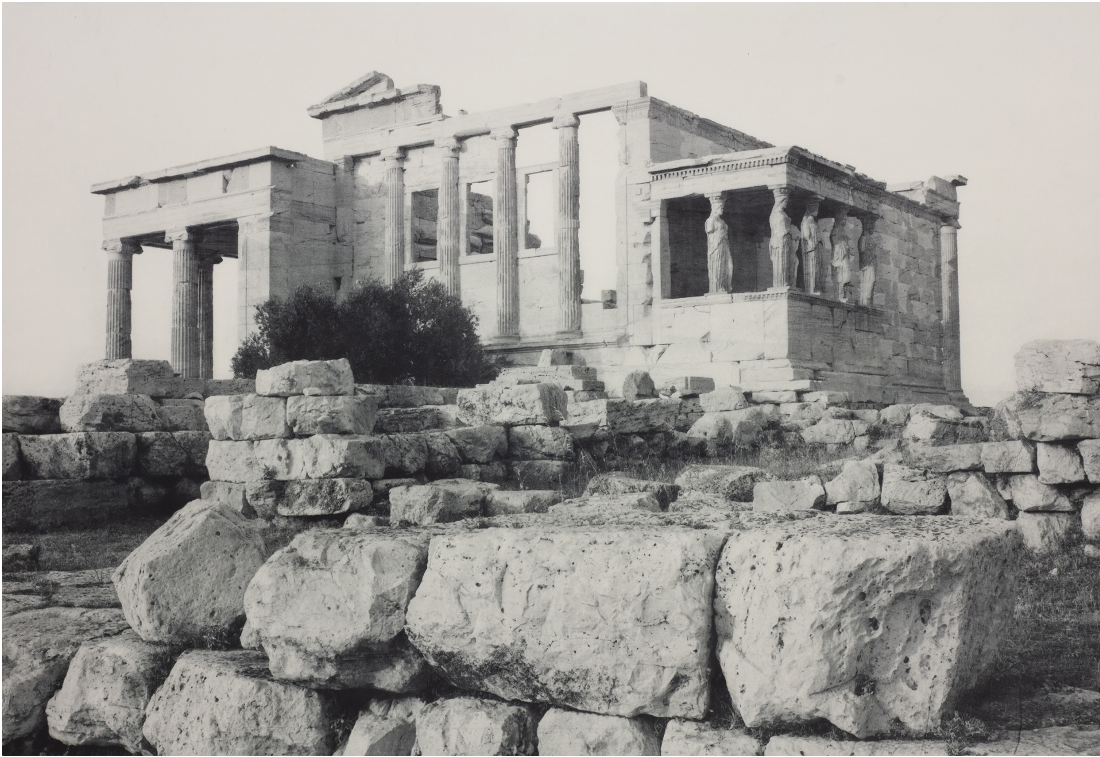
Athènes. Façade occidentale de l'Érechthéion, 2019.

les couleurs d'Aristote, n'est pas la seule destination du voyage temporel de James Welling. Depuis 1998, celui-ci se tourne vers les technologies numériques et la palette colorimétrique du logiciel Photoshop, avec le bénéfice esthétique de « libérer la couleur » du carcan du sujet et de sa condition historique : « Des couleurs intenses et de la feuille d'or mettaient en valeur textiles, cheveux et carnation », explique-t-il à propos de Cento et de son hommage à la statuaire grecque ; « les reconstitutions modernes de cette polychromie étonnent les visiteurs encore habitués à la pureté de l'idéal de beauté néoclassique. Mais je ne me suis pas uniquement intéressé à recréer la palette des Grecs anciens. Avec la technologie numérique, j'ai appliqué sur les sculptures des couleurs clairement antinaturelles dans l'idée que celles-ci s'infiltreraient dans la pierre ancestrale et prennent vie indépendamment. »