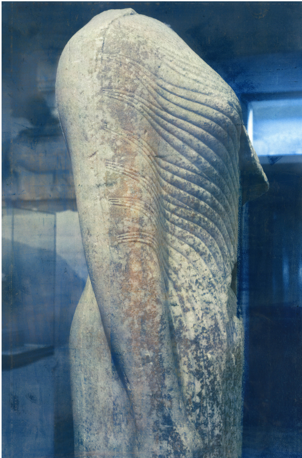
Kore from the Kheramyas Group, 2020.