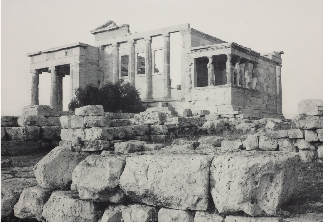
Athens. Western Façade of the Erechtheion, 2019.

Aristoteles herneemt. Dat is echter niet de enige bestemming in de tijdreis van James Welling, die sinds 1998 bezig is met digitale technologieën en het kleurenpalet van het softwareprogramma Photoshop, dat als esthetisch voordeel heeft dat “kleur bevrijd wordt” uit het keurslijf van het onderwerp en zijn historische context: “Intense kleuren en bladgoud accentueerden textiel, haar en huidskleur,” zegt hij over Cento en zijn hommage aan de Griekse beeldhouwkunst. “Moderne benaderingen van deze polychromie wekken verbazing bij bezoekers die nog vertrouwd zijn met het neoklassieke schoonheidsideaal. Maar ik ben niet geïnteresseerd in het louter hercreëren van het (kleuren)palet van de oude Grieken. Met behulp van digitale technologie heb ik op de sculpturen heel onnatuurlijke kleuren aangebracht, vanuit het idee dat ze doorsijpelen in de eeuwenoude steen en een eigen leven gaan leiden.”