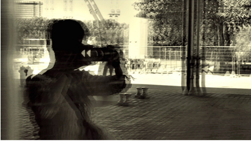
Still uit het videogedicht I & THEM