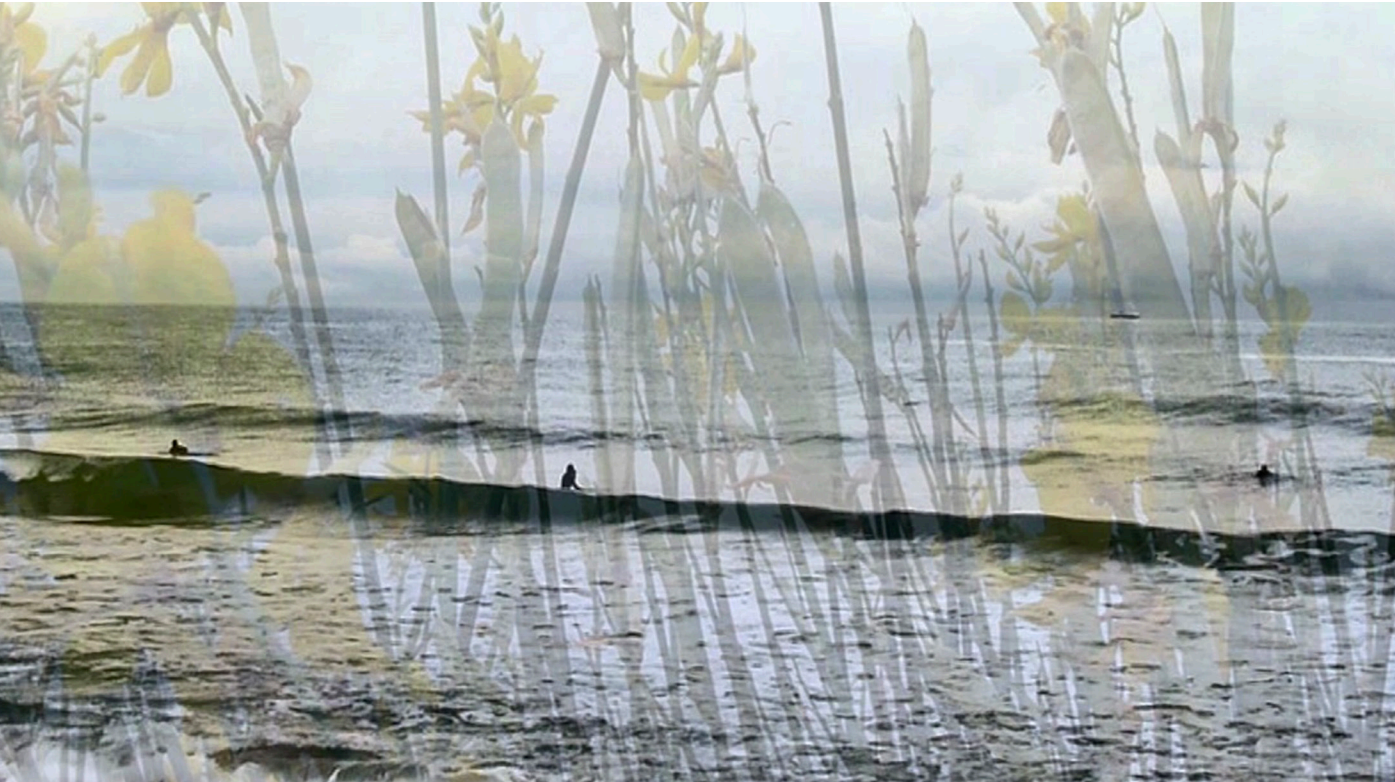
Stills uit de video's Gaps , 2014 (boven) en @TENDRE , 2021 (onder)