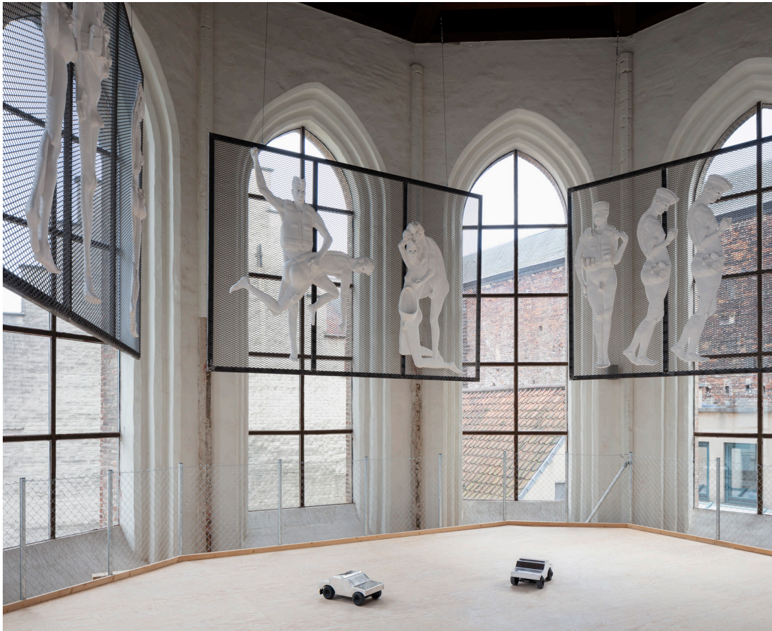
Tentoonstellingszicht, As Sirens Rise and Fall , Kunsthal, Gent, 2021.

met artificiële intelligentie, leven in de brouwerij. Deze voertuigen met geluid zijn geprogrammeerd om de typische trajecten van politiepatrouilles na te bootsen. Ze passen zich aan aan het gedrag van het publiek, dat van zijn kant met hen interageert. De geproduceerde geluiden evolueren volgens de choreografie van de auto's en doen denken aan politiesirenes en de repressie van onwettig gedrag, bijvoorbeeld seks op openbare plaatsen. Het 'gezag' van de auto's, dat gezien wordt als een allusie op de hersenschimmen uit de mythologie, is fascinerend op een verontrustende manier; de vergelijking met orgiastische muziek is niet veraf.