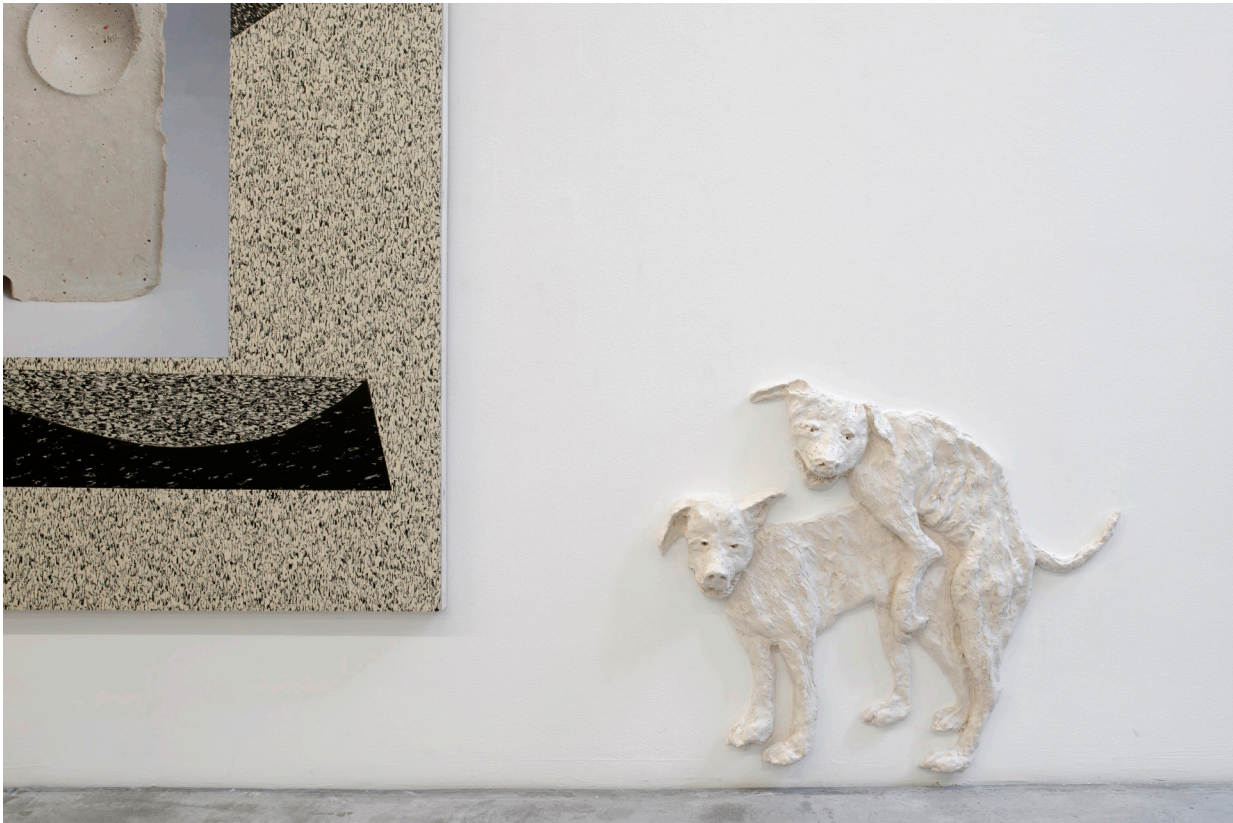
Tentoonstellingszichten, Urine Mate , Galerie Baronian Xippas, Brussel, 2016.