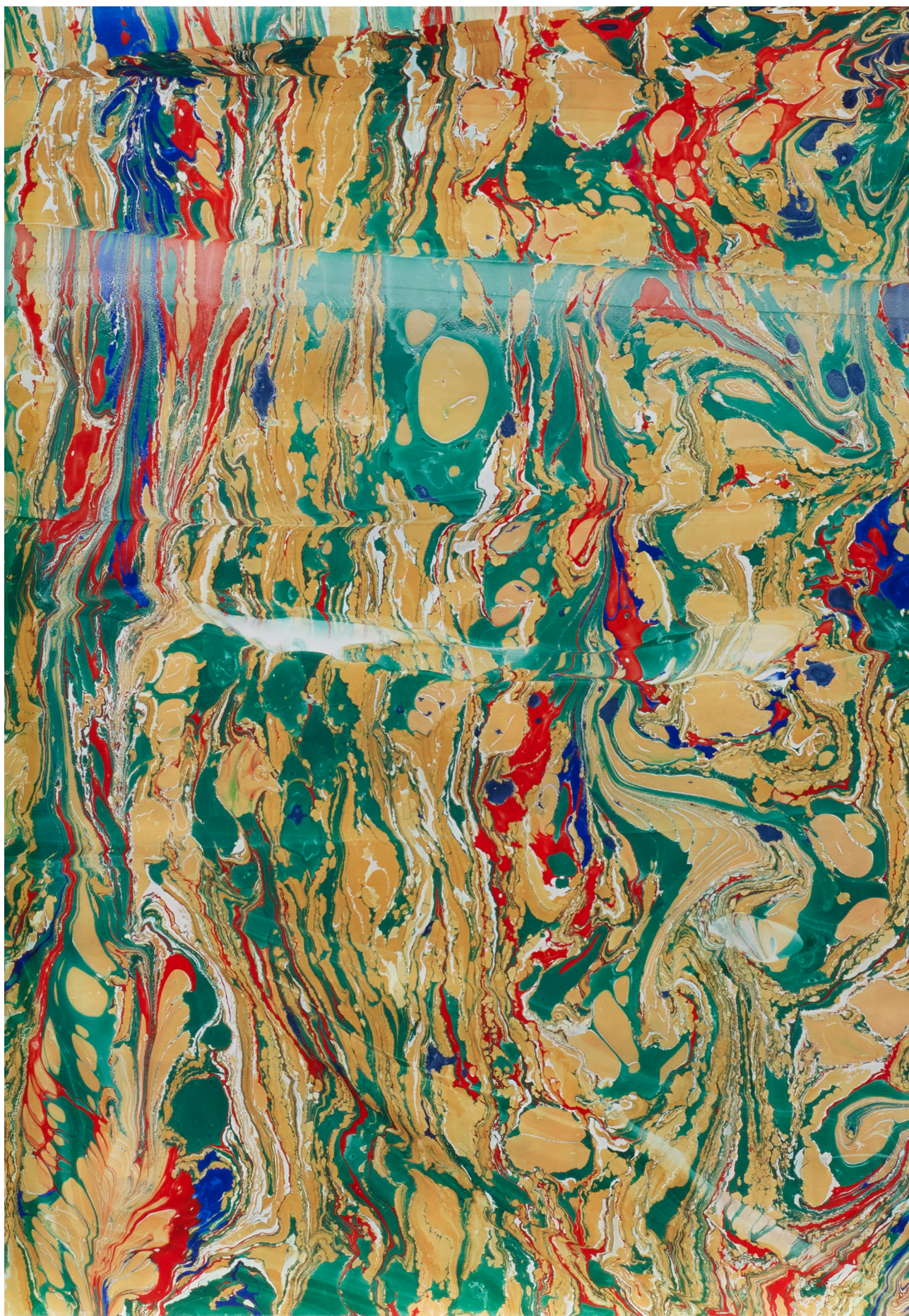
Le Groupe et La Famille (detail), 2010. © Kristien Daem