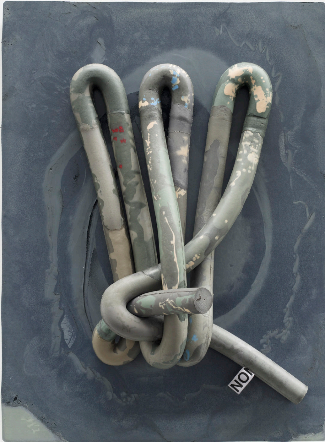
Baloney!, 2020-2022.