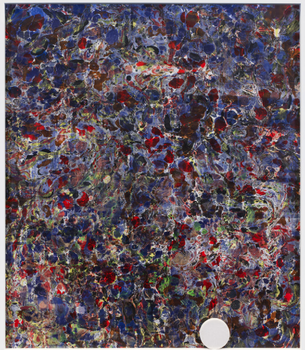
Le Groupe et La Famille , 2010.

Claude al eerder tentoongesteld heeft in Vitrine Gallery, Bermondsey Square in Londen – en die tijdens een performance op de FIAC van Parijs gedragen werd door diverse figuren uit de kunstwereld, is de tentoonstelling voornamelijk toegespitst op drie belangrijke ensembles: Le Groupe et La Famille (2010), Orchestral Issues (2015-2017) en Baloney! (2020-2022).