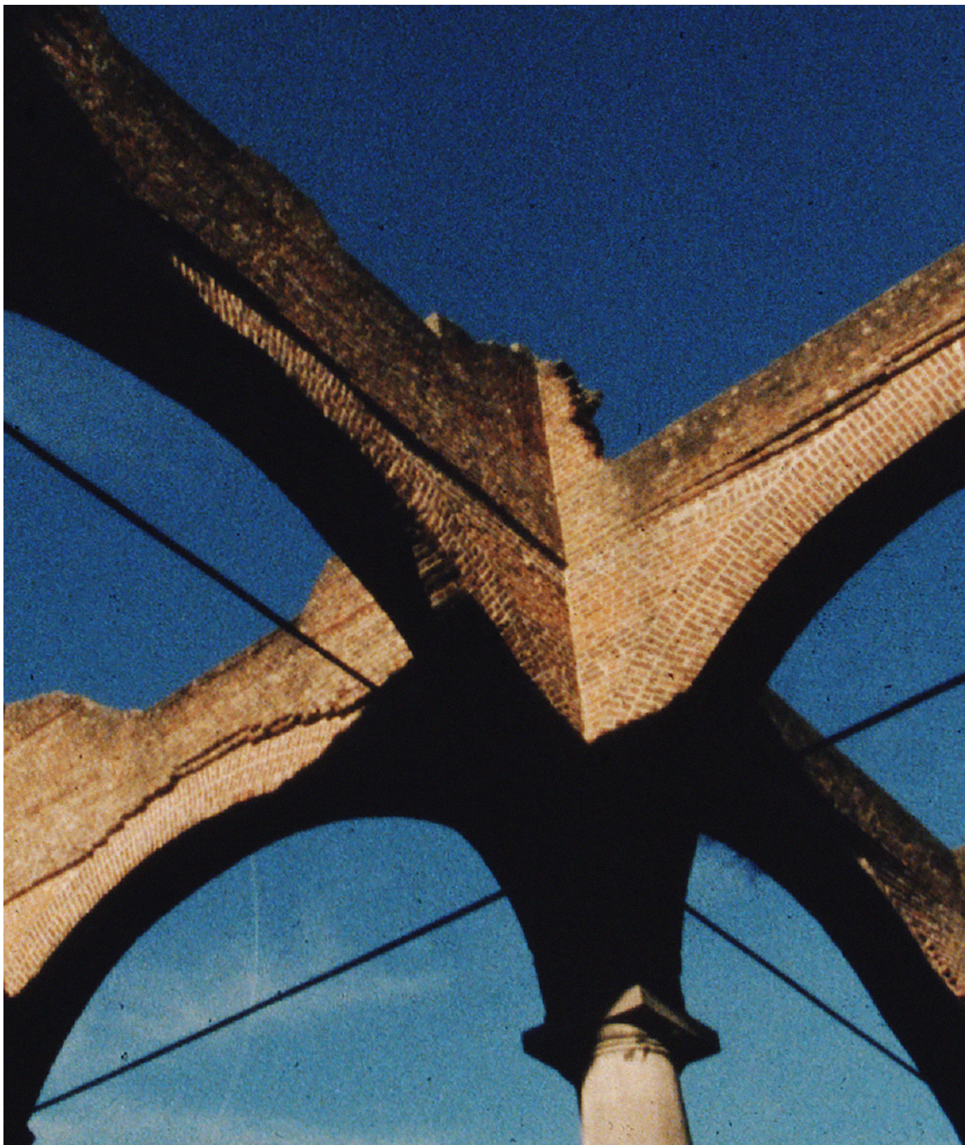
Fiona Tan, Ruins , detail, 2020. Courtesy van de kunstenaar, Peter Freeman Inc., New York en Frith Street Gallery, Londen. © SABAM Belgium 2021