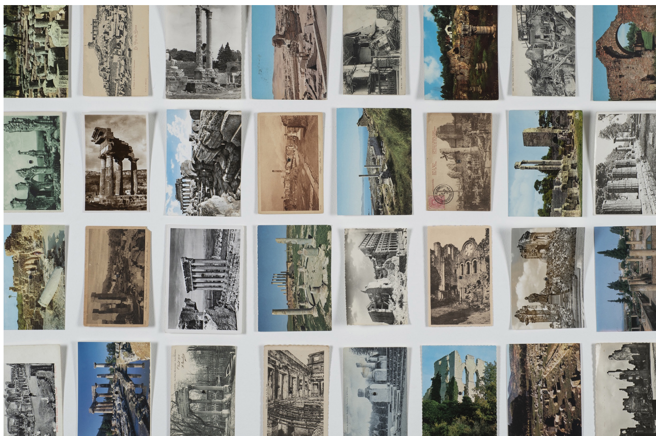
Oriol Vilanova, Vues imaginaires , detail, 2017.