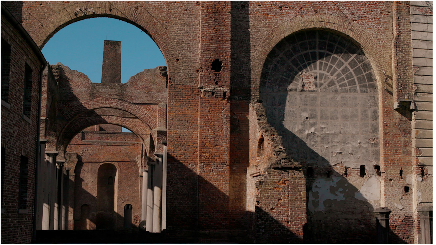
Fiona Tan , Ruins , détail, 2020.