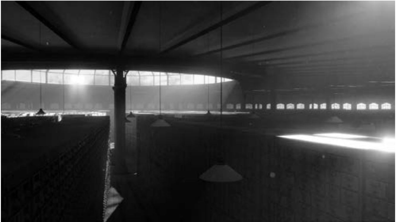
Archive, 2019. Extraits de l'animation numérique, noir & blanc, sans son, 4,5 × 2,53 m.