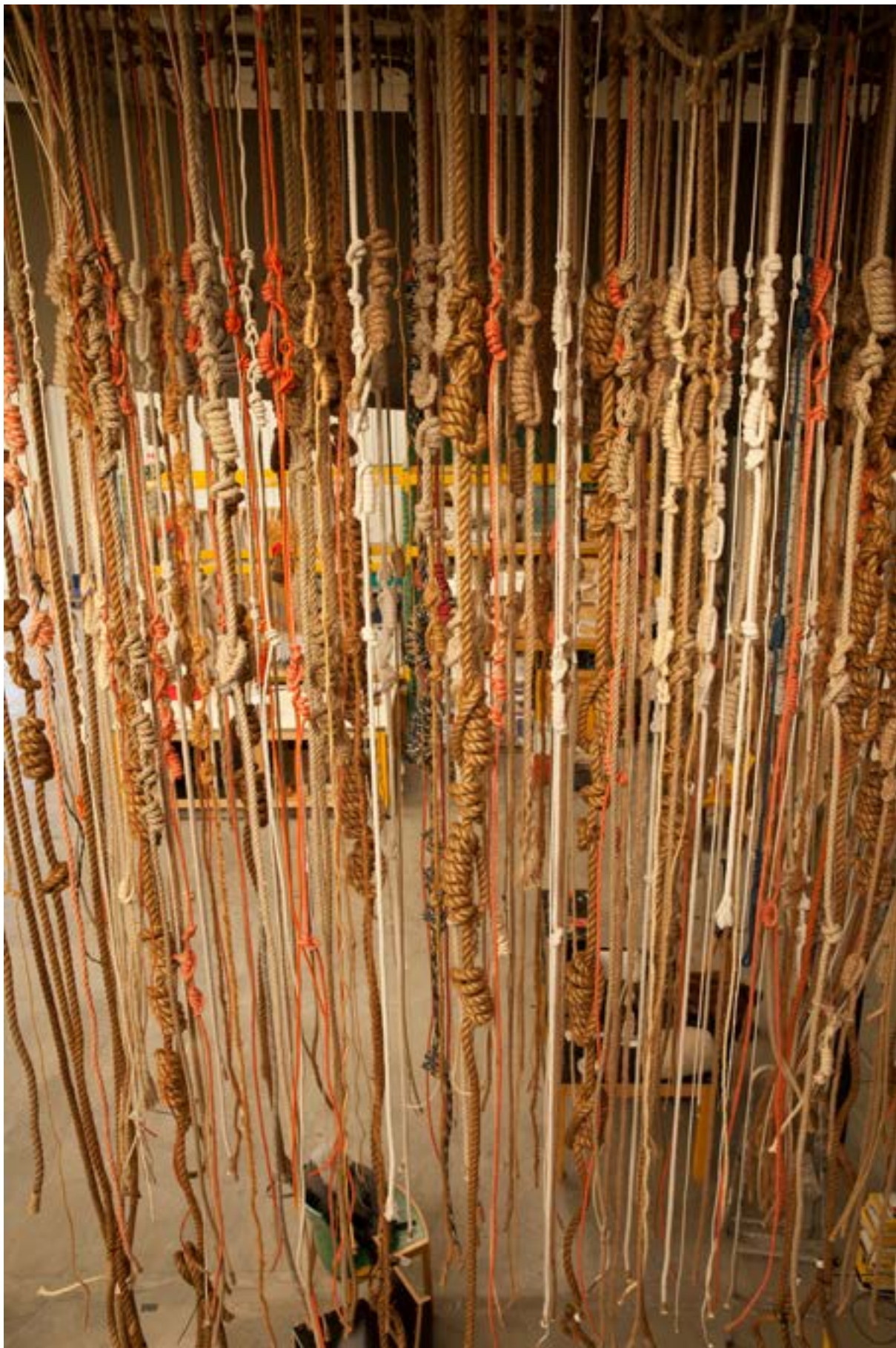
Circular Ruins Installation, techniques mixtes, 2019