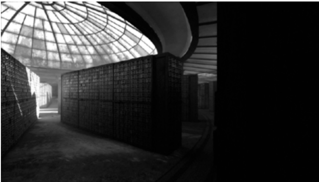
Depot , 2015. Extrait de l'installation vidéo HD