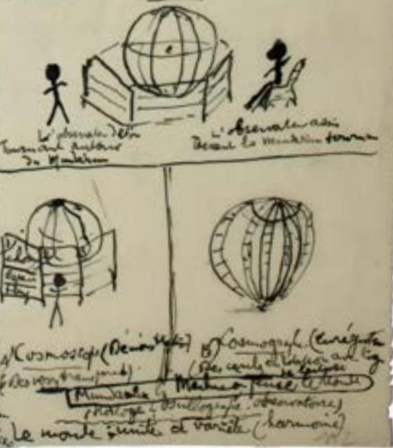
Papers by Paul Otlet