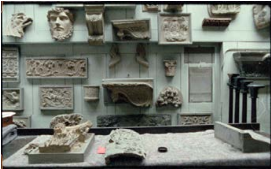
Inventory , 2012. Extrait de l'installation vidéo HD,

Si Fiona Tan persiste à investiguer inlassablement notre regard et le statut des images, son propos s'est dernièrement élargi à de nouvelles questions. Elle s'attarde désormais sur les raisons qui poussent l'Homme à collecter, archiver, garder, mais aussi sur le rôle du musée et du pouvoir qu'ont les archives de « représenter et d'interpréter l'histoire et la place de l'Homme dans celle-ci ».